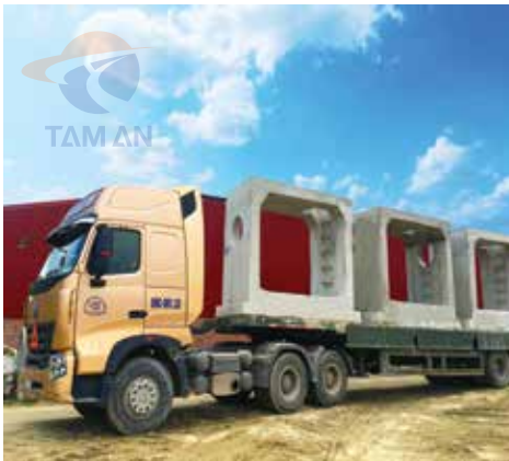
Ga cống hộp xuất xưởng Concrete manhole on shipping