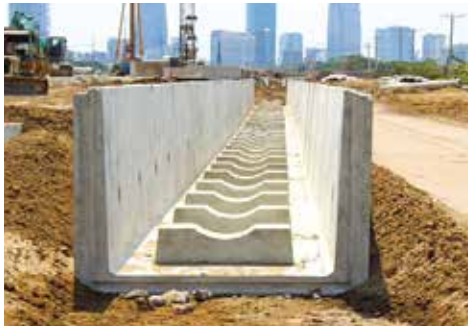
Rãnh bê tông kỹ thuật Technical concrete trench