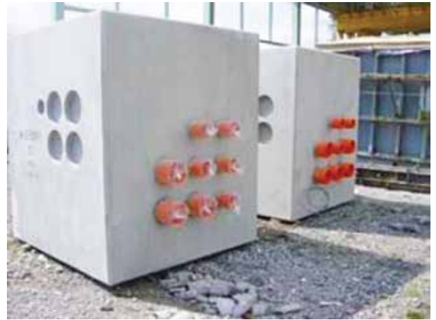
Hố ga cáp điện đúc sẵn Precast electricity manhole cable pit