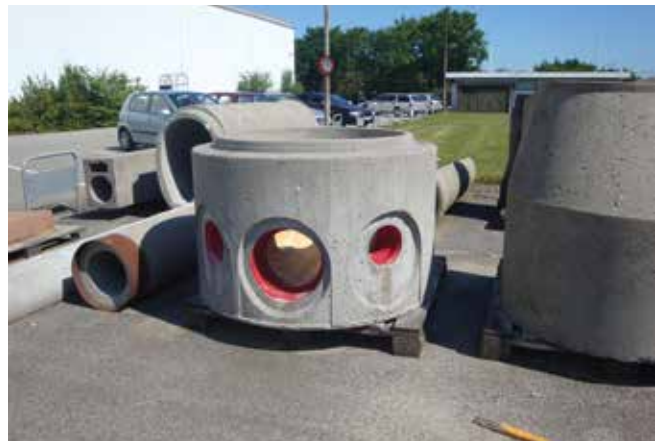
Hình ảnh ga tròn bê tông đúc sẵn Precast cylindrical manholes