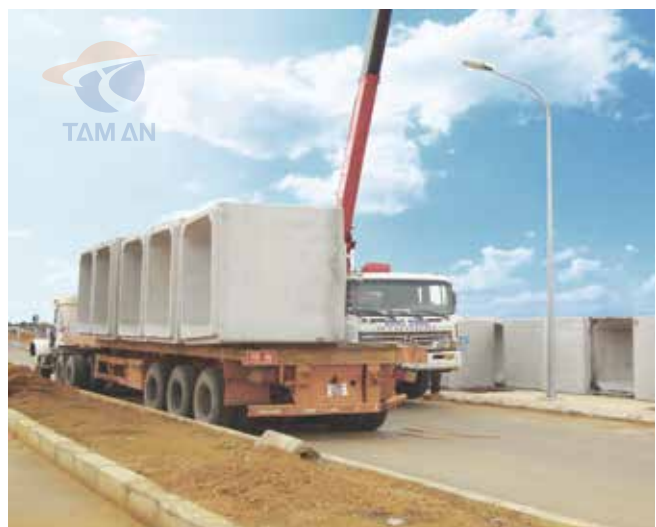
Hình ảnh lắp cổng hộp tại công trường Installation of box culverts at construction site