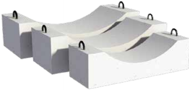
Đế cống Bearing for pipe