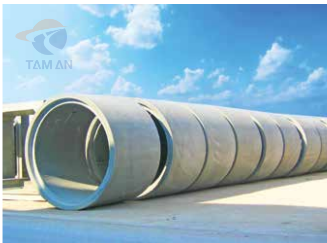
Cống tròn đúc sẵn theo thiết kế dự án Concrete pipe according to project design