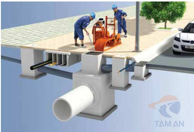
Mô hình lắp đặt ga thăm ga thu thoát nước Installation model of manhole for water drainage