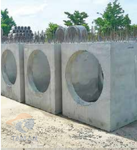
Hố ga bê tông đúc sẵn Concrete manhole