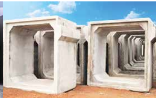
Cống hộp có vai Jacking concrete box