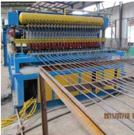
Máy hàn thép tự động Automatic welding machine