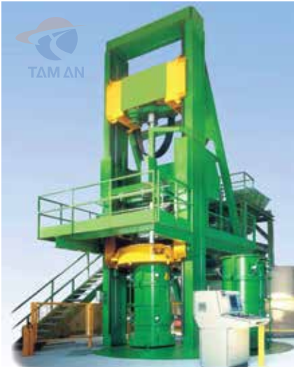
Công nghệ sản xuất cống tròn Concrete pipe machine