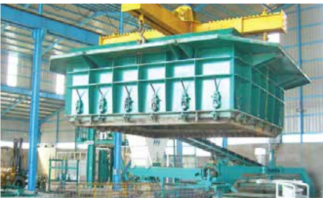
Dây chuyền sản xuất cống hộp tự động Automatic concrete box production line