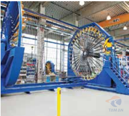
Máy hàn lồng thép tự động Automatic welders