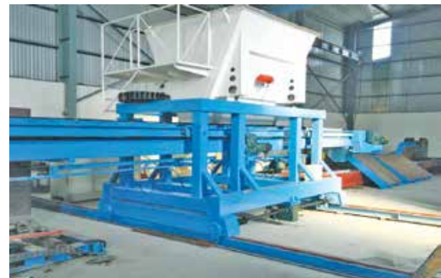
Hệ thống cấp liệu Automatic sewer production line