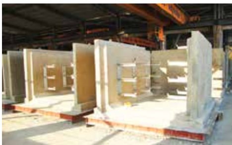
Hào kỹ thuật bê tông đúc sẵn Precast concrete technical trenches