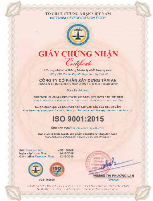
Giấy chứng nhận hệ thống quản lý chất lượng Certificate of quality management system