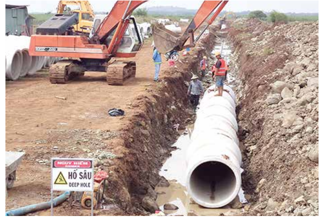
Hình ảnh lắp đặt Installation