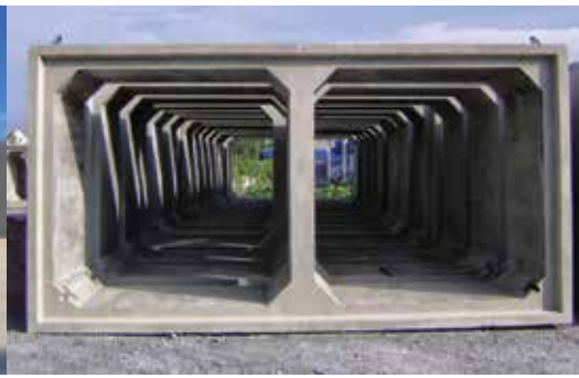
Cống hộp đôi Double concrete box