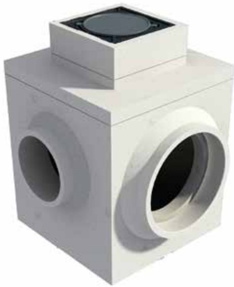
Hố ga bê tông hoàn thiện Completed concrete manhole