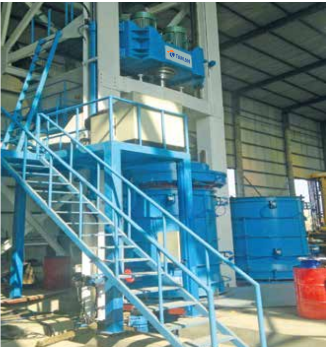
Dây chuyền sản xuất cống tròn tự động Automatic concrete pipe production line