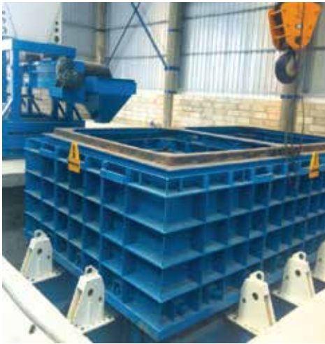
Dây chuyền sản xuất cổng hộp The production line of concrete box