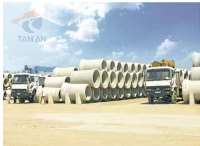
Cống tròn đúc sẵn công nghệ rung ép - L = 2,5m Concrete pipe manufactured with compaction-vibration technology - L=2.5m