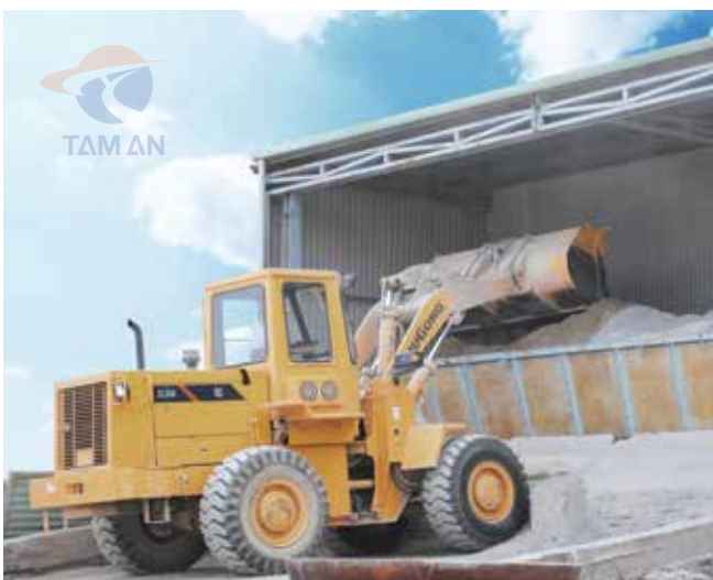
Hình ảnh cấp liệu vào phễu Materials are added in through the hopper