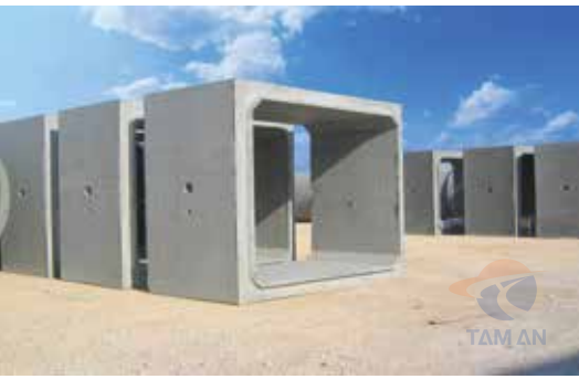
Cống hộp đơn Single concrete box