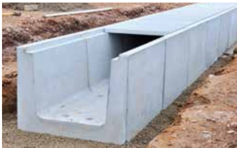
Rãnh bê tông kỹ thuật Technical concrete trench